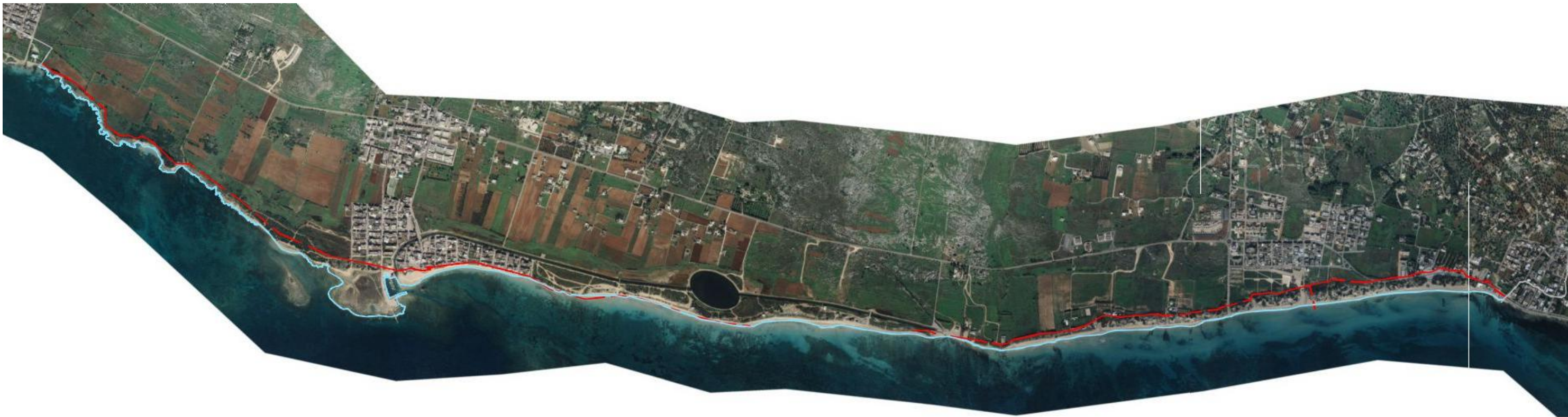
Ortofoto Regione Puglia - volo aereo anno 2010